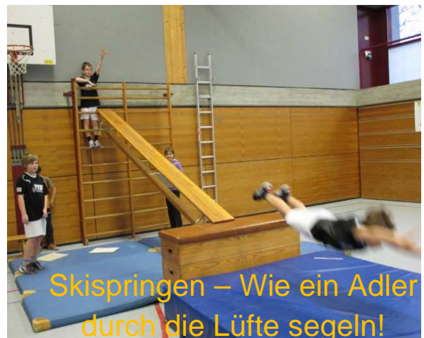
Skispringen – Wie ein Adler durch die Lüfte segeln!