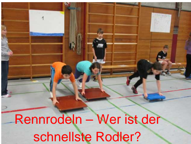
Rennrodeln – Wer ist der schnellste Rodler?